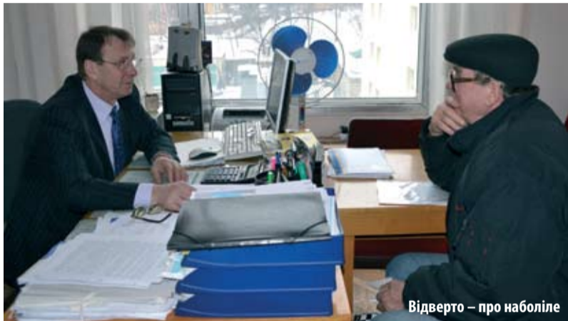
Відверто – про наболіле

Як відомо, Україна проголосила себе країною із соціально орієнтованою економікою. Однак всі ми є свідками того, як стрімко знижуються рівень і якість життя, зростає соціальна напруга та невпевненість у завтрашньому дні. Розпочаті Урядом соціально-економічні реформи, зокрема адміністративна, трудова, податкова, пенсійна поки що не позначилися на покращенні життя та добробуту населення. Занепокоєння профспілок викликає зростаюча соціально-економічна нерівність і поширення бідності в суспільстві. Федерація профспілок закликала свої членські організації, інші громадські організації взяти активну участь у відзначенні цієї дати, ще раз