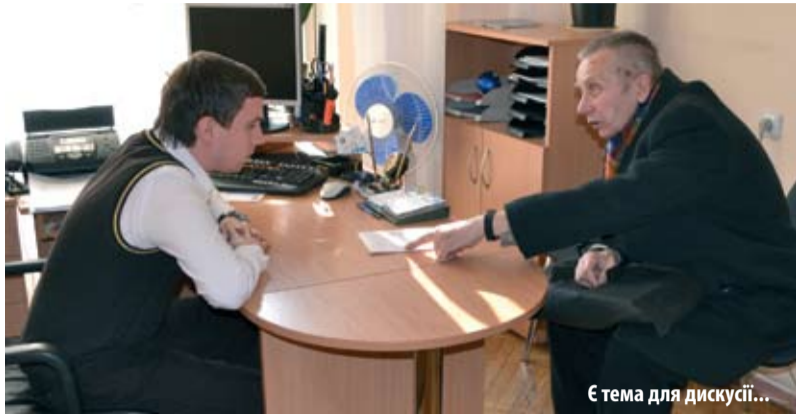
Є тема для дискусії...

Згідно з Указом Президента України Віктора Януковича 20 лютого в Україні проголошено Днем соціальної справедливості