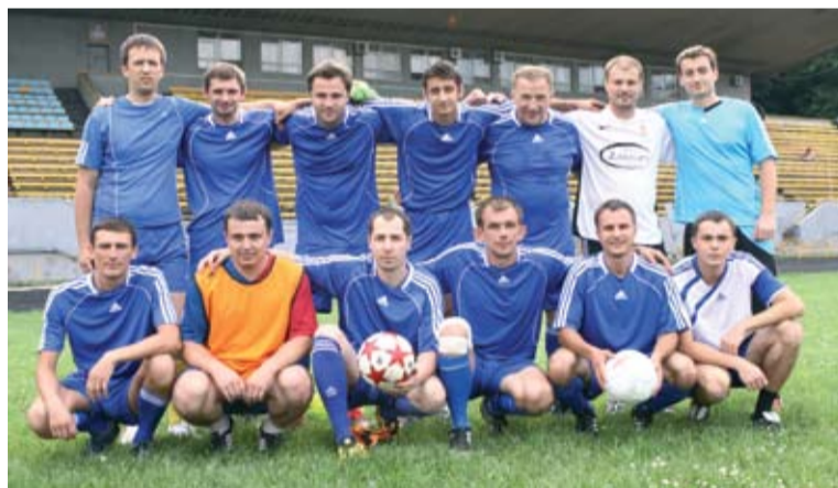
Футбольна команда ВАТ «Фармак» завжди зі своїм головою профкому