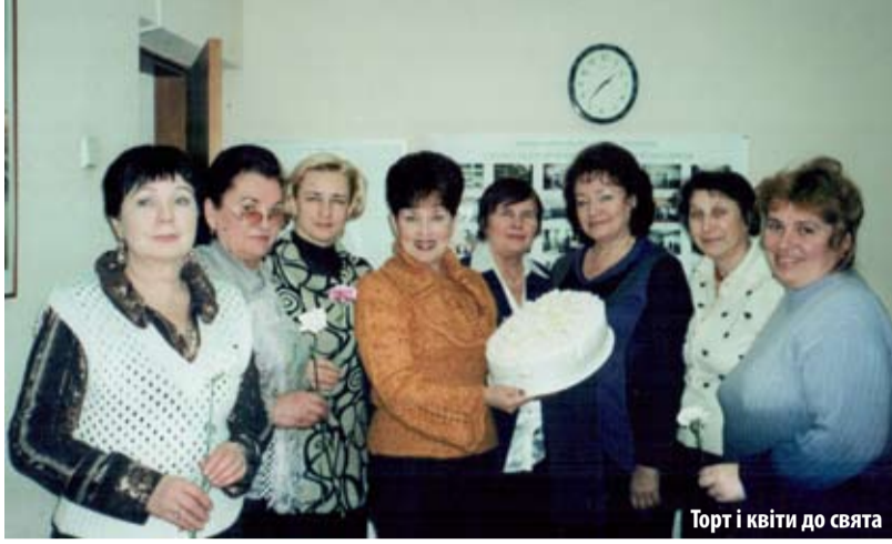
Торт і квіти до свята

Вірність професії, сумлінна праця, відчуття високої відповідальності за доручену справу, любов до рідного міста стали невід'ємними рисами працівників наших підприємств. І ці традиції передаються від покоління до покоління.