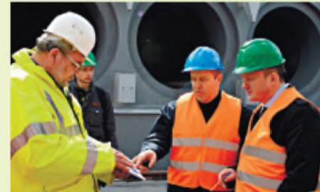
Візит міністра екології та природних ресурсів О. Семерака на ЧАЕС, 16 квітня 2016 року

Треба, щоб люди знали, що те, що ми маємо сьогодні, – це величезне досягнення не тільки нашого колективу, не лише наших підрядників, а й усього світового співтовариства, залученого в цей процес. Для того, щоб отримати гарні результати, було виконано величезний обсяг робіт різними компаніями з усього світу, у тому числі й російськими. Приміром, у період з 2005 до 2008 р. російський «Атомбудекспорт» разом з українськими підрядниками «Південтепломонтаж» та «Укренергомонтаж» стабілізували об'єкт «Укриття». То були найскладніші роботи всередині об'єкта у важких радіаційних полях. Завдяки цьому ми одержали перший досвід, що дає можливість рухатися далі. Пишаємося, що під час реалізації цього проекту ми навчилися працювати безпечно, без загрози для життя людей!